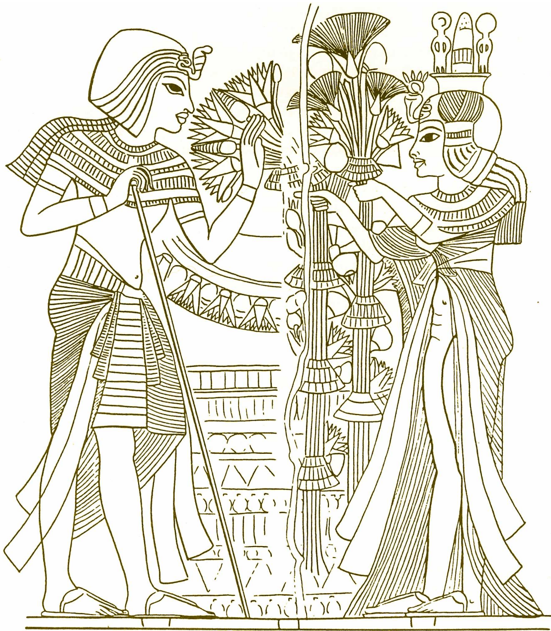
König Tutanchamun und Königin Anchesenamun , Elfenbeinplatte vom Deckel einer Truhe aus dem Grab des Tutanchamun (um 1300 v. Chr.)