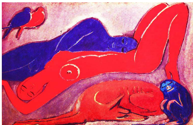
Kees van Dongen · Quietude, Frieden, Ruhe

Die du wohnst in den Gärten, laß mich deine Stimme hören; die Gefährten lauschen dir. Flieh, mein Freund! Sei wie eine Gazelle oder wie ein junger Hirsch auf den Balsambergen!